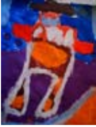
(Ilustración de Marcos Cruz, 7 años).

Ukat tarukat inch"i... Waris mirin maxt'riw si, suma maxt'akiriw allqa kalsunani. «Jumá Manis jaqimájtati» «Nä jaqishta, nä kunarä jan jaqikiristti. Suma ak'am, paru surmiruni maxt'askt nä, ak'am injatitay». Ukat uk jan amtktti... Lumat lum jap'aqui, lumat lum, qalat qal sariri sasaw kirk'tatäw si, «Wal wari jap'naqiriki», sasaw kirk'tatäw si. Uk jan sum yatti.